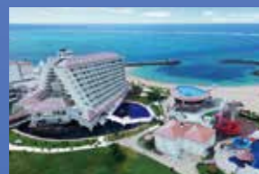
シェラトン沖縄サンマリーナリゾート