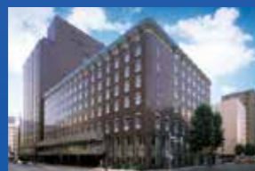
札幌グランドホテル