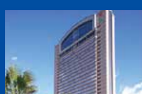
ホテル京阪ユニバーサルタワー