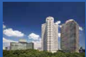
ホテルニューオータニ・ガーデンタワー