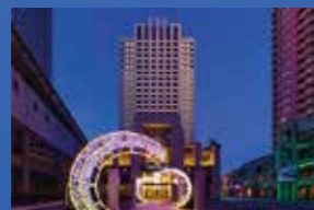
ザパークフロント ホテルアットユニバーサル・スタジオ・ジャパン