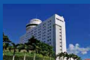
ノホテル沖縄那覇