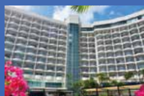
ロワジールホテル那覇