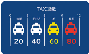
気象防災情報をもとに、タクシーの混雑予想を知らせる「TAXI指数」のイメージ

「宿泊業に軸足を置きながら、分野を限定せずにお客さまを広げていきたいですね。気象防災情報を業務の変革・効率化に活用すべき事業領域は、まだまだあるはず。今後、より多くのお客さまに気象防災情報をわかりやすい形で届け、事業と社会に貢献していきます」